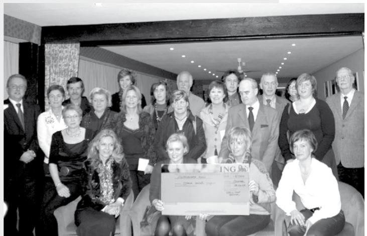
De dames serviceclub Inner Wheel Oostende heeft reeds langer een hart voor “de Kiem”. Zij steunden onze werking het voorbije jaar opnieuw met een gulle gift.