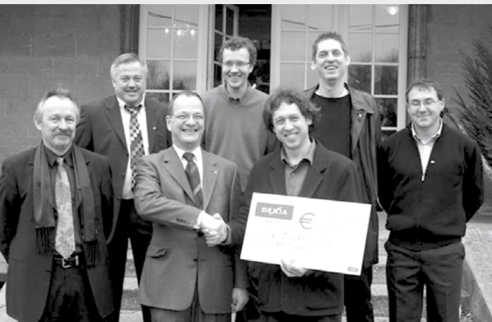
De serviceclub SERVAID steunde onze werking met een gift van 1250,- €.